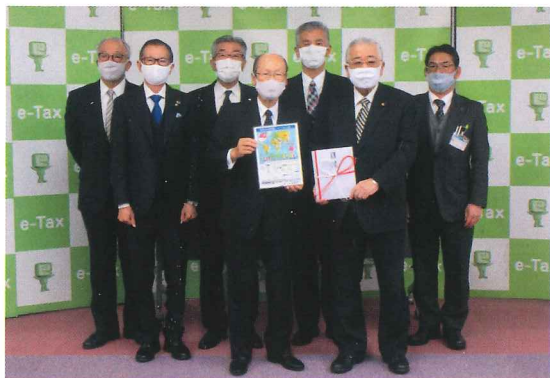
クリアファイル贈呈式(於：富山税務署)

クリアファイル裏面下部には、令和元年度「税の標語」全国間税会総連合会 最優秀賞の「知ろう学ぼう考えよう 日本を支える 消費税」が掲載されています。