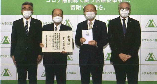
コロナ対策基金への贈呈式(於:富山県庁)